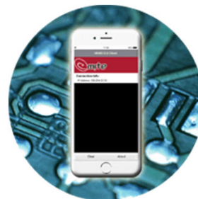
事前校正チャンバー/OSアプリ

iOS, Mac, Android, Linux, UWP, Windows, Tizen対応