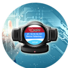
小型デバイス用テスト